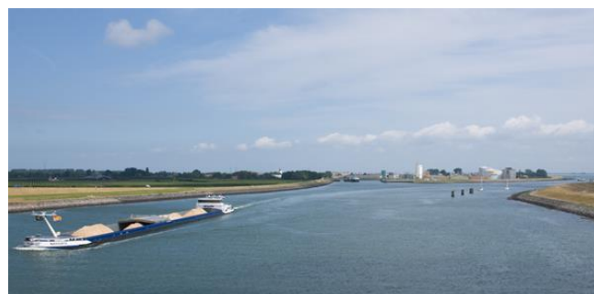
Het Kanaal door Zuid-Beveland

Hoewel altijd een sterk watergerichte provincie zijn er in het kleine Zeeland, niet geheel onverwacht, geen echt lange kanalen te vinden. De Schelde-Rijnverbinding ligt ook nog eens op de grens met Noord-Brabant, maar is statisch toegerekend aan Zeeland. Het vormt een belangrijke vaarverbinding tussen Antwerpen en de Rijn. Het Kanaal door Walcheren en het Kanaal door Zuid-Beveland doorsnijden dit schiereiland en vormen een veilige verbinding tussen Westerschelde en Oosterschelde. Het Kanaal van Gent naar Terneuzen loopt nog 15 km. verder door in België en is één van de meest industriële kanalen van ons land. Er lopen diverse programma's om in deze kanaalzone industrie, wonen, landschap en recreatie beter op elkaar af te stemmen. Het Zijkanaal naar Hulst is een voorbeeld van de in Zeeland veel voorkomende vaarten en kanalen die aansluiten op de (voormalige) krekken en zo dorpen en steden verbonden met de zeearmen.