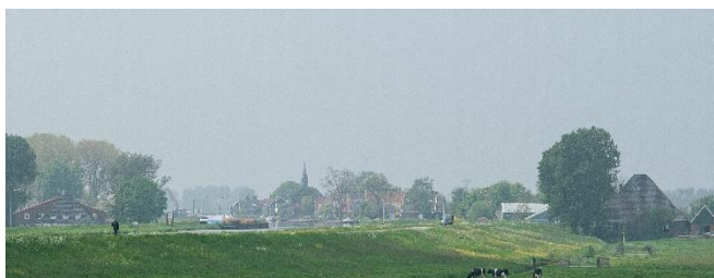
Het Noordhollands Kanaal

In Noord-Holland komen de grote ringvaarten van de drooggelegde meren duidelijk naar voren. Het zijn kunstmatig aangelegde waterwegen, maar door het grillige verloop van de meren hebben ze vaak ook een natuurlijke uitstraling met een kronkelige verloop. Zeker in het UNESCO-monument Beemster is er landschappelijk veel fraais te zien langs de vaart. Het Kanaal Alkmaar-Kolhorn maakt deel uit van een omvangrijk kanaalstelsel in Westfriesland ter bevordering van de economische ontwikkeling in het gebied.