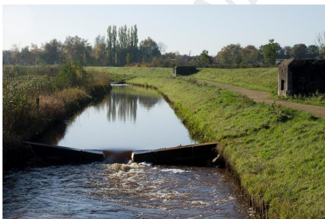
Het Defensie- of Peelkanaal

In de grote provincie Noord-Brabant komen ook een aantal lange kanalen voor. De lengte van de Zuid-Willemsvaart betreft alleen het deel in Noord-Brabant (en wijkt daarom af van de totale lengte in top 20). De kanalen waren en zijn van groot belang voor de industriële ontwikkeling van deze provincie. Het Wilhelminakanaal en het Eindhovens Kanaal zijn hiervan goede voorbeelden. In tegenstelling tot andere provincies zijn in Noord-Brabant minder goed bevaarbare natuurlijke waterwegen aanwezig. In de jaren dertig van de vorige eeuw zou de Maas pas beter bevaarbaar worden gemaakt. De Bergse Maas is een onderdeel van deze omvangrijke Maaskanaliseringsplan en betreft een nieuw gegraven loop voor de Maas. In het westen van Brabant werd al vroeg turf vergraven. De nu niet meer bevaarbare Turfvaart bij Breda is hiervan een karakteristiek voorbeeld.