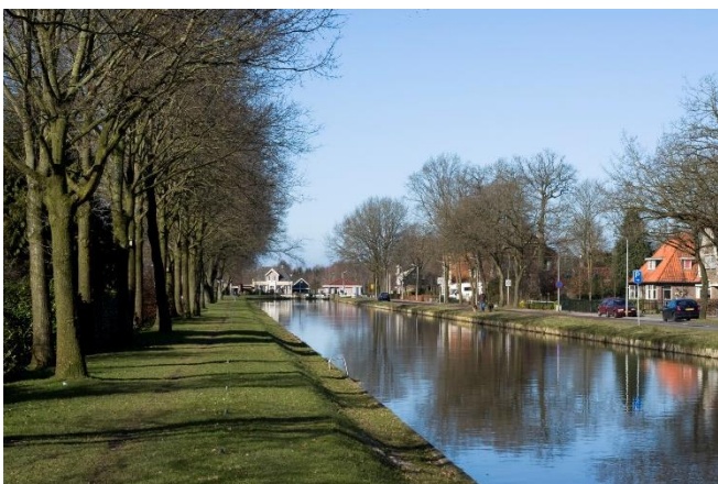
De Verlengde Hoogeveense Vaart

Willemskanaal ligt voor bijna 9 kilometer in de provincie Groningen en heeft een totale lengte van 28,3 kilometer.