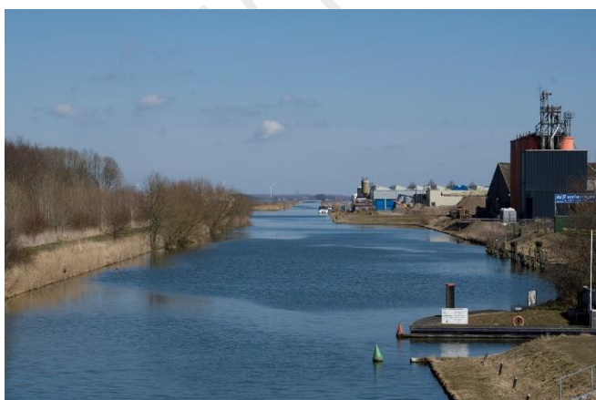
De Hoge Vaart

In Flevoland is de schaalvergroting na elke inpoldering goed te zien. Was in de Noordoostpolder nog sprake van vaarten van 10 tot 15 km. In Oostelijk en Zuidelijk Flevoland werd het nog grootser aangepakt met de Lage en Hoge Vaart. Bijzonder aan de Noordoostpolder is dat vrijwel elk dorp zijn eigen vaart kreeg. Deze vaarten takken aan op de hoofdvaarroute van Lemster via Emmeloord richting Urk of Krabbendijke. Overigens liggen ook alle dorpen en steden in Oostelijk en Zuidelijk Flevoland aan een vaart, maar hoewel het gebied groter is, zijn hier veel minder dorpen en steden aangelegd.