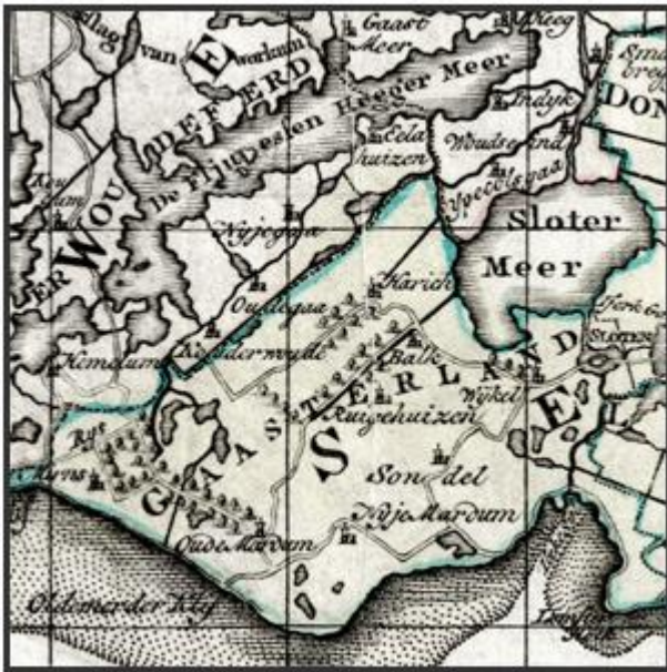
Kaart van Gaasterland uit 1782.