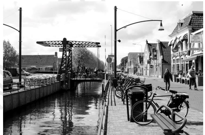
De Luts in Balk met mooie karakteristieke bruggen.

De Luts schijnt ooit een rivier te zijn geweest, maar in alles lijkt het nu een kanaal. Wie zich nog een Elfstedentocht kan herinneren weet wellicht ook dat deze schaatstocht over de Luts gaat. Het is een karakteristiek stuk. De Luts is smal, ligt tussen hoge oevers en wordt begeleid door hoog opgaande bomen. Dat geeft een soort van tunneleffect. Langs de Luts is zowel goed te wandelen (vooral langs de oostzijde) als te fietsen (westzijde). Na de bossen van De Starnuman staan er wat meer boerderijen langs de Luts. De aangrenzende landerijen maken het landschap meer open.