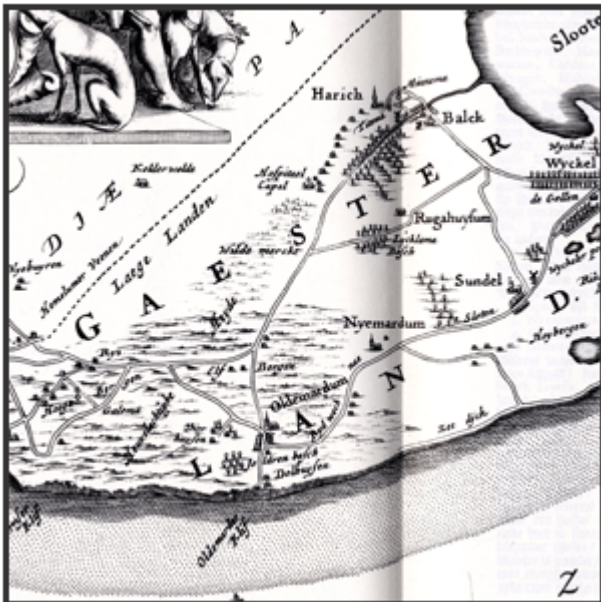
Kart van Gaasterland uit 1664.