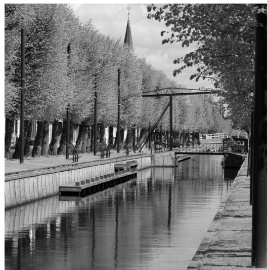
De Luts in Balk.

kaarten wordt ondersteund. Het Gaasterland is eerst een gebied met vooral wouden en heide met aan de flanken enkele dorpen en buurtschappen. Tussen de heuvels en aan de voet van de heuvels is sprake van moerassen en plassen. De Luts is de enige rivier in het gebied en loopt vanaf de noordzijde van de heuvels naar het Slotermeer bij Balk. In de 17e eeuw ging dit beeld veranderen. De Rijstervaart wordt aangelegd, terwijl de Merdersloot wat lokale plassen met elkaar verbindt en voor een verbinding tussen de Fluessen en de Zuiderzee zorgt. Hiermee is het zuidwestelijke deel van het Gaasterland ontsloten door vaarwegen. In de 18e eeuw ontstond met de Sondelervaart een ontsluiting van het gebied aan de oostzijde. Hiermee werd het gebied aangehaakt op de belangrijke vaarverbinding over de Ee. De 19e eeuw stond in het teken van het verbinden van de vaarwegen tussen het westen en noorden van het Gaasterland. De Luts wordt via de Van Swinderenvaart aangesloten op de Merdersloot en Rijstervaart. De Merdersloot heeft dan al haar belang als verbinding met de Zuiderzee verloren. Dat maakt de nu ontstane verbinding tussen Fluessen en Slotermeer via de Van Swinderenvaart en de Luts des te aantrekkelijker. Via enkele zijtakken, zoals de Sminkevaart, worden aanliggende gebieden ontsloten en ontwaterd. Aan het eind van de 19e eeuw werd tenslotte de Zandvaart aangelegd als lange, maar ook wat solitaire vaarweg. Aan de noordzijde werd aangetakt op de Sondelervaart.