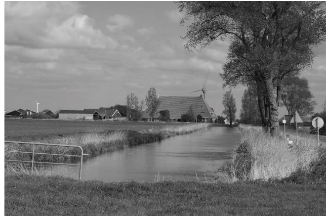
De Sondelervaart stroomt naar de Ee.

direct aan de vaarten, zodat je gemakkelijk zonder problemen je eigen weg kunt volgen. Dat maakt het tot een klein avontuur in ons te vaak verhekte en dichtgetimmerde landje.