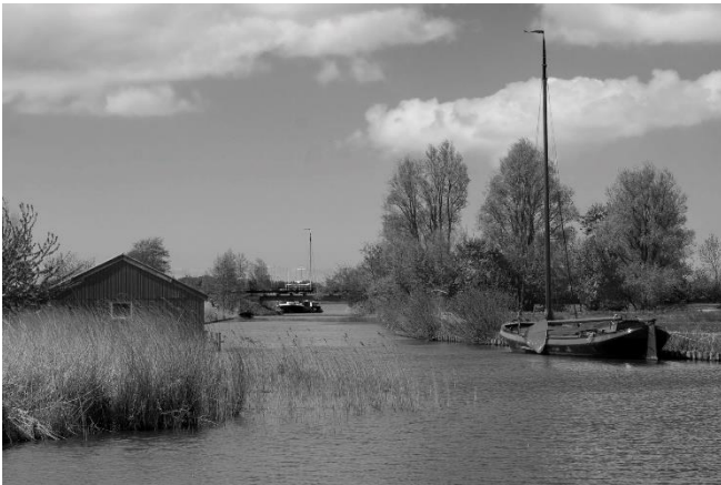
De Rijstervaart bij de uitmonding in de Fluessen.

De Rijstervaart volgend naar de Fluessen moet er al gauw gestruind worden. Er zullen een aantal hekken met prikkeldraad moeten worden beklommen om de vaart te kunnen volgen. Eerst loop je dan een tijdje evenwijdig aan de provinciale weg, maar al gauw buigt de vaart af en wordt het steeds landschappelijker en mooier. De Rijstervaart slingert hier langzaam door bloemrijke weiden. In de verte zie je her en der de oranje daken van de stelpboerderijen. Na ruim een kilometer gaat het struinen over in een onverhard pad en is er zelfs weer te fietsen.