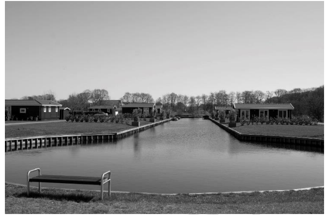
Nieuwe insteekhaven en brug bij chaletpark aan de Witakkersvaart.

Bij deze nieuwe boogbrug sta je ook weer bij de Witakkersvaart zelf. Deze vaart is verder niet al te breed en loopt recht door de akkers richting het noorden. Een begeleidend voet- en fietspad ontbreekt. Omdat er ook geen aanliggende erven zijn, besluit ik over de weilanden langs de vaart te lopen. Dat voelt altijd wat stiekem en onzeker, maar het is de moeite waard. Het gedeelte leent zich goed voor een mooie wandeling. Opvallend zijn een tweetal dammen die voor het landbouwverkeer worden gebruikt. In deze dammen is wel een uitsparing voor de vaart gemaakt, maar deze is niet al te groot. Dat vraagt nog wel om enig werk wil men hier vanaf het chaletpark kunnen varen naar de Spookhoekstervaart.