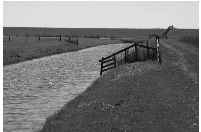
De Sefonstervaart loopt dood op de Sefonsterdijk. Geen spoor van een voormalige sluis.

Gaand over het pad valt al gauw op hoe stil en landelijk het er is. Het heldere blauwe water van de vaart, de aanliggende zacht glooiende heuvels, het felgroene lentegras en het feit dat blijkbaar niemand hier komt maken het tot een kleine idylle.