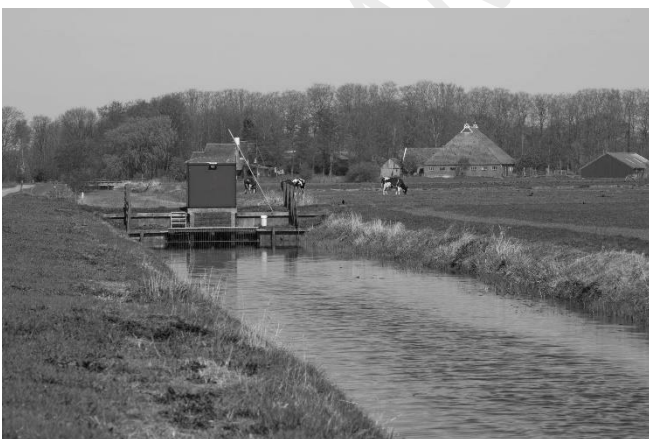
De Sefonstervaart nabij Rijs.

In het begin van de middeleeuwen is Gaasterland nog een woest land met veel bos gelegen tussen moerassige lage gronden. Met de ontwikkeling van de landbouw beginnen de mensen ook het Gaasterland in cultuur te brengen. Op de flanken van de heuvels ontstaan nederzettingen. De bossen worden gebruikt als graasgronden en worden ook op kleine schaal gekapt voor het hout en de verbetering van de vruchtbaarheid van de gronden. Het gevolg is dat de bossen geleidelijk degenereren tot heidevelden en zandverstuivingen. Dat het er redelijk goed boeren is, bewijst de aanwezigheid van een uithof/kapel bij Rijs. Deze uithof is één van de belangrijkste boerderijen van de abdij van Stavoren (later gevestigd in Hemelum).