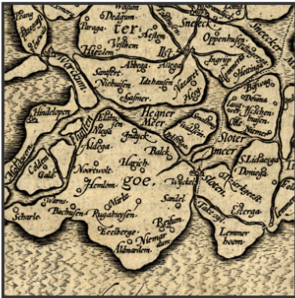
Kart van Gaasterland uit 1579