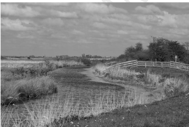
De Zandvaart bij de Sonderleien.

de vaart ook steeds meer te maken met afdammingen ten behoeve van niet openbare boerenerfwegen om bij de landerijen naast de dijk te komen. Verderop bij de toepasselijk genaamde Sânfærtsdyk kom ik weer langs de Zandvaart te fietsen. Het is landschappelijk een mooie vaart, zoals deze door bloemrijke weiden loopt. Via de afdammingen kun je met wat klimwerk de dijk opkomen waar vanaf mooie uitzichten wachten. Het beeld wordt echter getrokken door weer een gigantische windmolen aan het einder. Het is misschien wel een sympathieke manier van energiewinning, maar de visuele impact kan toch wel groot zijn. Hier is het storend, maar dat is eerlijk gezegd het hele erf hier. Het is maar goed dat het helemaal in de hoek van Gaasterland ligt en misschien is dat ook juist wel de aanleiding tot deze verrommeling geweest. De Zandvaart eindigt (of begint) op deze rommelige plek. Het is meteen duidelijk dat de vaart mooier te beleven is gaand van zuid naar noord. Tezamen met de Sondelervaart is het een beetje een buitenbeentje tussen de Gaasterlandse vaarten. Beide vaarten zijn in hun uiterlijk en ligging meer ter vergelijken met de Friese vaarten elders in de provincie en minder met hun directe burens die tussen de glooiende heuvels lopen.