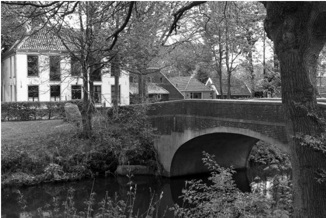
Bij de Kippenburg.

de 19e eeuw besloot jonkheer G. Van Swinderen een hoenderfokkerij te starten in wat nu De Starnumanbossen zijn. Daarbij liet hij het landhuis de Kippenburg bouwen. Het werd echter geen succes en in 1850 werden de activiteiten gestaakt. De Kippenburg werd een herberg, wat het tot 1985 zou blijven. Nu is het fraaie bouwwerk in het hart van het Gaasterland als vakantieverblijf te huren.