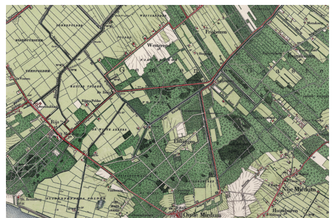
Centrale deel Gaasterland rond 1920.

de Luts, aan de westzijde van de Gaasterlandse heuvels. Aan de oostzijde van deze heuvels lopen echter ook nog twee kanalen. De oudste hiervan is de Sondelervaart die het dorp Sondel met de Ee bij Tacozijl (deels via de Nieuwe Vaart) verbindt. Bij Tacozijl ligt de sluis naar de Zuiderzee. Tot de aanleg van het Prinses Margrietkanaal was de Ee één van de belangrijkste vaarroutes tussen Friesland en de Zuiderzee. De Sondelervaart dateert van rond 1725. In 1848 is de vaart nog eens verbreed (en is vermoedelijk de Nieuwe Vaart aangelegd) en een halve eeuw later is er een zwaigat aangelegd bij het dorp. De vaart is van belang geweest voor het vervoer van goederen en grondstoffen (turf, zand, hout). De andere vaart is de Zandvaart die van de Sondelervaart bij de Sondelerleijen naar het buurtschap Gaastburen loopt. Voor het grootste deel loopt deze vaart direct ten westen van de Zuiderzeedijk. De vaart is rond 1890-1900 aangelegd. De functie voor transport was beperkt. Wellicht heeft er voor een korte tijd zandtransport over plaatsgevonden, maar de naam kan ook afgeleid zijn van in de directe omgeving aanwezige veldnamen, zoals Zandvoorderhoek. Het is waarschijnlijk dat de vaart vooral een waterhuishoudkundige functie had. Dat is in ieder geval in deze tijd het geval.