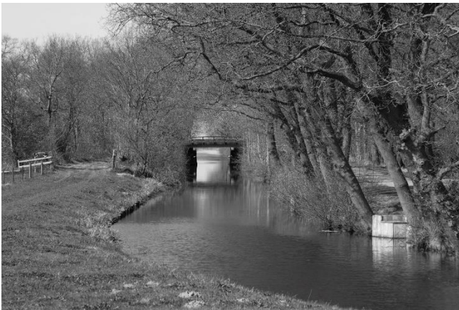
De Spookhoekstervaart bij de Zesde Brug.

de recreatiepaden goed te lopen langs de Spookhoekstervaart. Bij het buurschap Schouw komt deze vaart uit in de nieuwe plas. Een voetbrug (vroeger een voetveer) brengt je hier naar de overzijde. Hier zijn wat ligplaatsen en daar maakt de recreatievaart gaarne gebruik van. Hier loopt ook de Schouwvaart (eigenhandig genoemd naar het buurtschap). Deze smalle vaart loopt fraai door het land, maar is privé terrein, zodat het bij een blik over de vaart blijft.