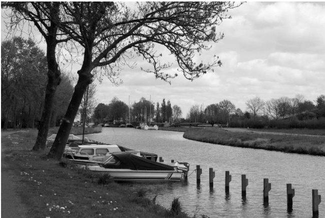
Veel recreatievaart aan de Luts nabij het Slotermeer.

Buiten het centrum loopt de Luts eerst langs nog wat oude en nieuwe bedrijventerreinen. Het was spijtig om te zien dat het monumentale gebouw van de veevoederfabriek 'De Volharding' nu is gesloopt. Een aantal jaren terug was ik nog zeer onder de indruk van dit, weliswaar leegstaande, gebouw. Wat rest is een kale vlakke (8). Ik weet dat het niet gemakkelijk is deze kolossale gebouwen her te bestemmen, maar ik mag hopen dat hier toch tot het uiterste daarnaar is gezocht. Het voelt nu als een groot gemis en dat zegt dan iemand die maar twee keer in Balk is geweest.